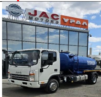
Автоцистерна для Тех. воды на шасси JAC N90. (2025г.в.)