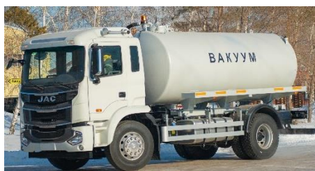
Автоцистерна вакуумная (МВ-5, МВ-7, МВ-11) на шасси JAC N90, N120, N200

4x2 (4x4) 2024 г.в., 152/166/245 л.с. Дизельный, кондиционер, спальник. Объем 5 000 л., 7 000 л., 11 000 л., насос – КО-503, КО-505, КО-510