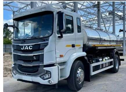
Автоцистерна для пищевых жидкостей (МОЛОКО) (АЦПТ-1,5, АЦПТ-5, АЦПТ-6, АЦПТ-10) на шасси JAC N35, N90, N120, N200

4x2, 2024 г.в. 130/152/166/245 л.с Дизельный, кондиционер, спальник. Опции: дополнительные секции, промывка цистерны, насос Объем: 1 500, 5 000, 6 000, 10 000 л. с насосом/без насоса