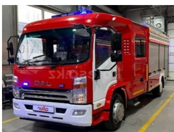
Пожарная автоцистерна АЦ-3,0-30 на шасси JAC N120.

4x2, 2023 г.в., 166 л.с., дизель. Объем цистерны для воды 3, 0 м³. Производительность насоса 30 л/с. Кабина боевого расчета с учетом водительского места 6 чел. Расположение насоса заднее. Емкость пенообразователя 180 л. Комплект пожарно-технического вооружения: Наличие.